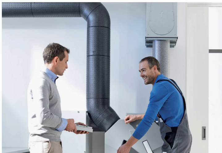
Der berufsbegleitende Lehrgang Fachfrau/-mann Komfortlüftung entspricht dem Stand der Technik und ist modular aufgebaut.